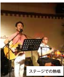
ステージでの熱唱

この夏の酷暑に疲れた心身を癒やすべく、平成29年8月29日午後6時30分より高田馬場「Cotton Club」にて、暑気払いが開催されました。相続アドバイザーが誕生してから早17年が経ち、すべての期の会員が一同に会せるようにと企画した今回の暑気払いですが、養成講座の第1期から直近の第40期まで40人近くの方々の参加があり、「久しぶり〜」「今頑張ってる?」など受講時代を懐かしむような会話が方々で聞かれました。